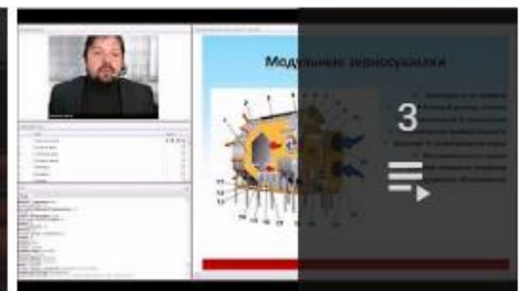
Вебинары по оборудованию