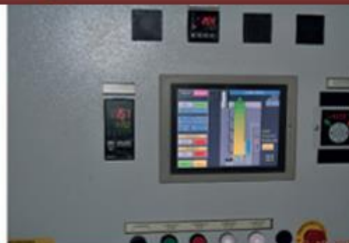
Пульт управления с ПО на русском языке