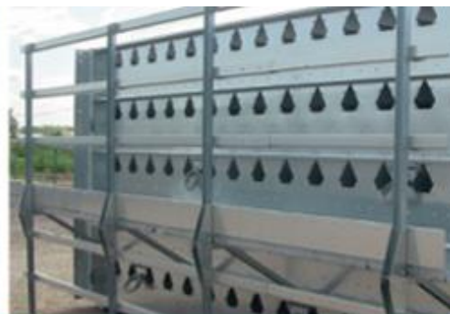
Панели из Aluzink – на 200% большая стойкость к коррозии