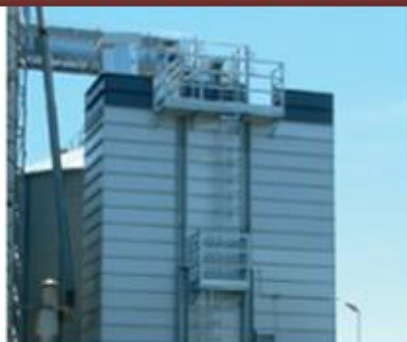
Наружные и внутренние лестни- цы в базовой комплектации