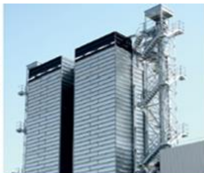
Полностью теплоизо- лированная шахта