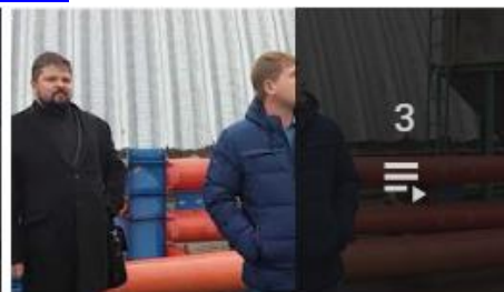
Интервью о работе техники