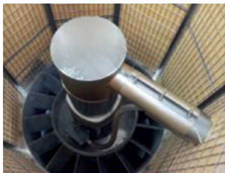
Бесшумные вытяжные вентиляторы

Герметичная колонна полностью исключает просыпание зерна