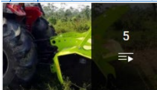
Тракторные мульчеры Niubo

Смотрите видео о тракторных мульчерах NIUBO на нашем канале