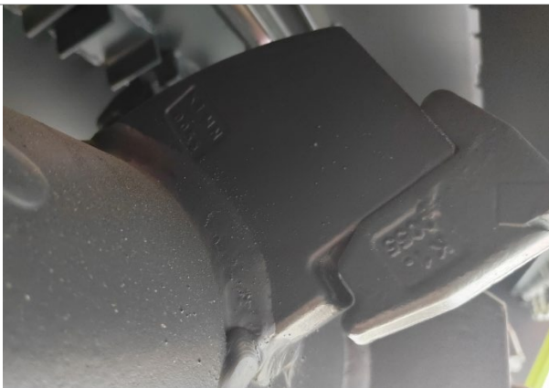
Резцедержатели удлинены, и имеют увеличенную массу