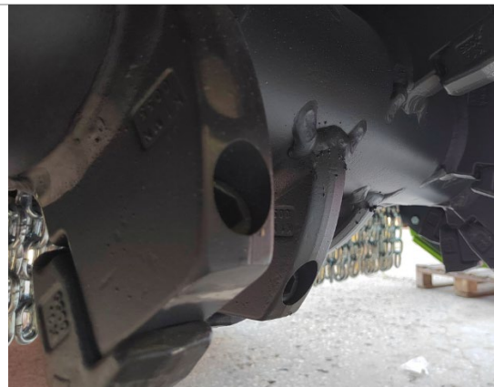
Крепление резца усиленным винтом