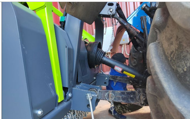
Трехточечная навеска с двумя парами крепления, верхняя точка с подвижным шарниром