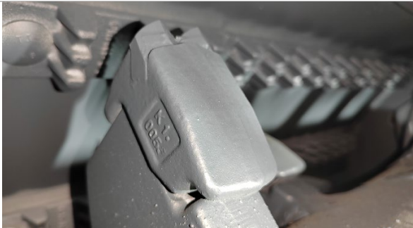
Резцы с двумя вставками карбида вольфрама