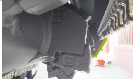
Сложная форма резца для защиты от проворота