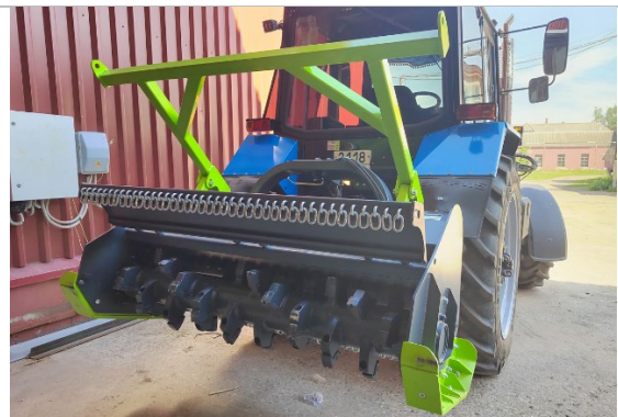
Мощный корпус, толщина листовой стали до 10 мм