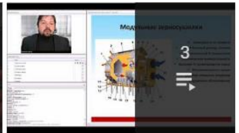
Вебинары по оборудованию