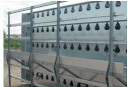
Панели из Aluzink – на 200% большая стойкость к коррозии