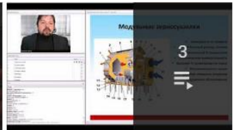
Вебинары по оборудованию