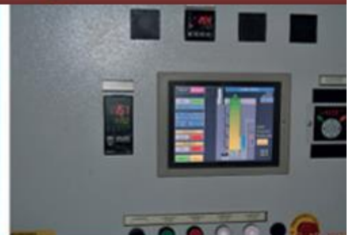
Пульт управления с ПО на русском языке