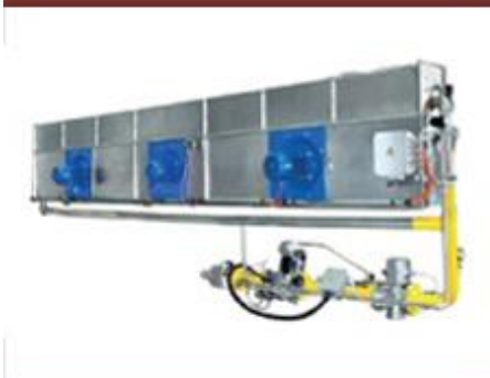
Линейная горелка Tesflat №1 в Европе