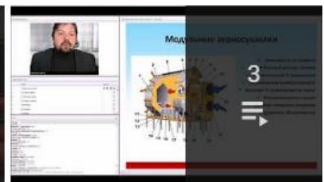
Вебинары по оборудованию